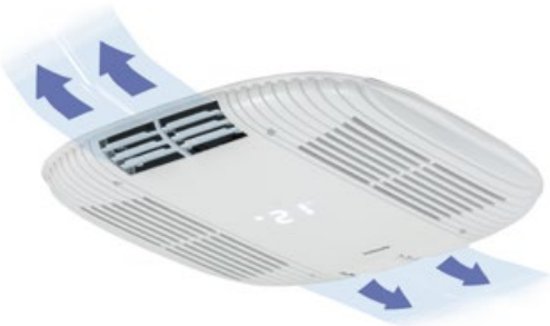
Cool Top Trail 20/24