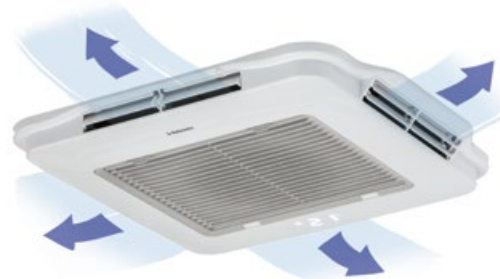
Cool Top Trail 34